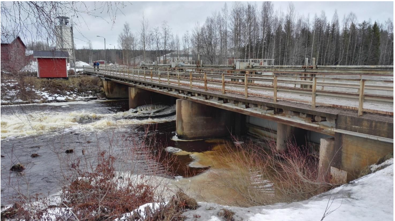
Haapakosken säännöstelypato

Haapajärven vedenkorkeutta säännöstellään Haapakosken säännöstelypadolla. Järven säännöstelylupa on Haapajärven järjestely-yhtiöllä, joka on siirtänyt käytännön säännöstelytehtävät Koskienergia Oy:lle sopimuksen perusteella. Säännöstelyn tarkoituksena on Haapajärven ylävirran puolella olevan tulva-alueen vapauttaminen haitallisista vedenkorkeuksista.